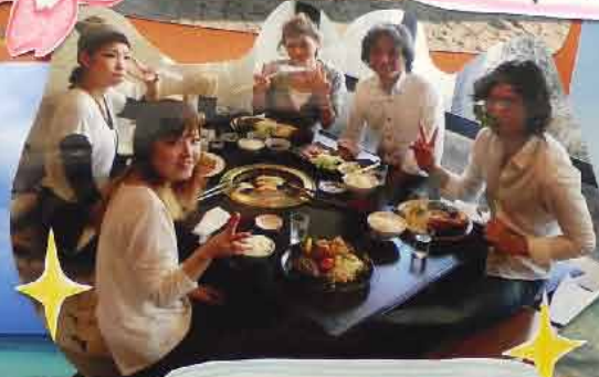
♡ 石垣牛 ♡ うまー!!