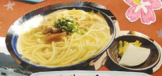
2日間で2回食べた八重んぼ